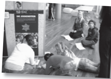
ანა ფრანკის შესახებ დაწერილი ტვიაკუს მაგალითი:

მოკლედ მოაყოლეთ მოსწავლეებს ანა ფრანკის ამბავი და დასვით რამდენიმე შემამზადებელი კითხვა, რომლებსაც შემდეგ გამოფენაზეც განიხილავთ. მოცემული დავალებების შესრულება მოსწავლეებს შეუძლიათ, როგორც ინდივიდუალურად, ისე ჯგუფურად.